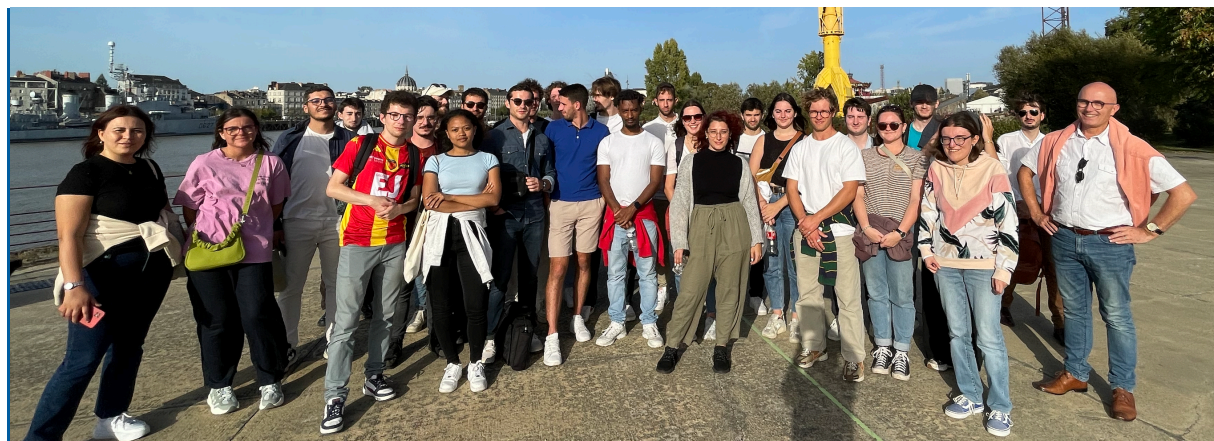
Promotion Master 1et 2 VEU Urbanistic – année 2023-2024 – Ile de Nantes

En rapport direct avec l'UE précédente, les outils techniques de l'urbaniste permettent à la fois de répondre aux missions d'aménagement proposées et de maîtriser les supports de présentation - communication (exposition du ou des projets aux élus, professionnels et universitaires, membres du jury de soutenance du projet finalisé) : posters, animation 3D de la mise en scène de l'opération projetée, plans masse, etc.