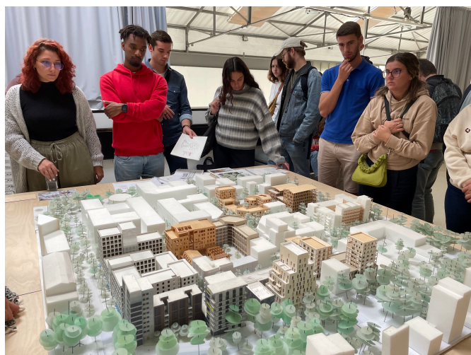
Promotion Master 1et 2 VEU Urbanistic – année 2023-2024 – Maquette Ile de Nantes